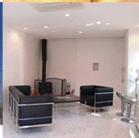
▲1Fエントランスには薪ストーブ。冬は暖かくゲストをお迎えします。