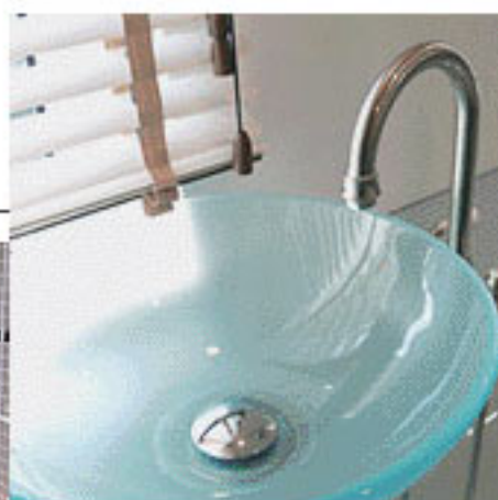
▲水周り用品はメンテナンス性を考慮し米国Kohler社等メジャーメーカーの物を採用。