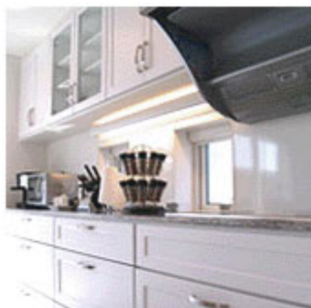
▲キッチン天板から全てオーダーメイド(食器洗浄器等も組み込まれたアメリカンスタイル)

家具・バスキッチンから、水栓金具・照明機器など屋内主要設備はアメリカ・ハワイにてスタッフがセレクトしました。一般的に輸入製品は価格・仕様面で難しいイメージを抱かれがちですが、弊社では直接取引に現実的な価格帯にてご提案させていただいております。Loco-Latteにて実際にレイアウトされた各部屋をお楽しみください。