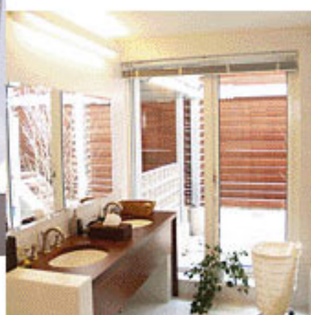
▲パウダールームには中庭から明るい日差し。

* ソーラーサーキットシステムに関する詳しい内容は こちら(株)カネカウェブサイト をご覧ください。